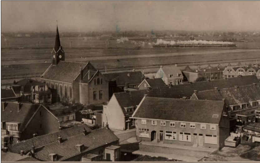
Foto genomen waarschijnlijk rond 1950. Tussen Kralingse Veer en Rotterdam zijn slechts weilanden te zien. Op de achtergrond de trein van station Rotterdam Maas richting Utrecht over het tracé waar nu de Van Rijckevorselweg loopt.