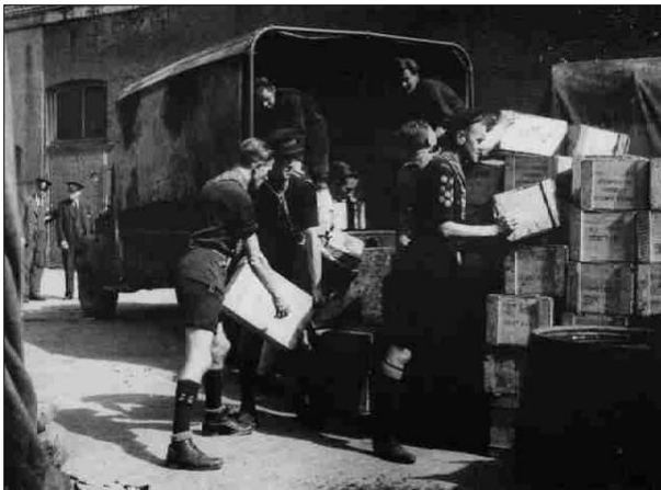
Mei 1945: Padvinders helpen in Rotterdam bij het overladen van Engelse voedselvoorraden.

Op 8 mei 1945 om 8.00 uur zette een colonne van Scout International Relief Service Teams zich in beweging, via de Veluwe Zoom naar de Grebbeberg. De keuken- en kantinewagen teams waren doorgereden naar onder meer Rotterdam. Daar werden de Pijlkop en het Klaverblad op de wagens en de uniformen door het herrezen padvindsters en padvinders herkend en bestormd. Ze boden onmiddellijk hulp, ook al stonden de meisjes en jongens en hun leiding door de ondervoeding vaak te beven in hun schoenen, voor zover ze die nog hadden. In de grote steden begon men, in overleg met de plaatselijke artsen, voedsel te verstrekken aan de zeer zwakken en de zeer ondervoeden, die niet in staat waren naar de kantine-wagens te gaan om voedsel, een mengsel van biscuit en melkpoeder in water gekookt, in ontvangst te nemen.