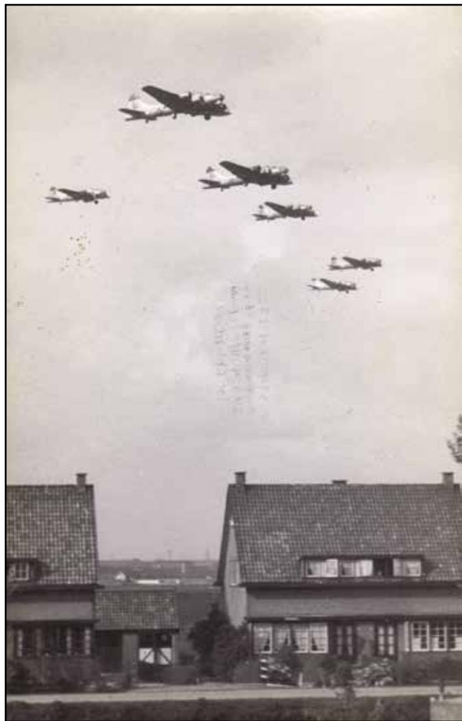
De voedseldroppings in 1945.

"We waren toch wel even ongerust toen er op 30 april zoveel vliegtuigen aankwamen. We hadden wel geruchten gehoord dat er voedseldroppings zouden komen, maar je wist toch maar nooit. Het afwerpveld was waar nu de wijk Nieuw Terbregge ligt. Eerst kwamen de jagers die het afwerpveld markeerden met magnesium of fosforgranaten. Dat ging wel eens fout wanneer die granaten te dicht bij de huizen uitkwamen. Een paar huizen zijn erdoor in brand gevlogen. Daarna kwamen de bommenwerpers. De Engelse Lancasters en de Amerikaanse B-17's hadden toestemming om heel laag aan te vliegen om zo precies mogelijk de voedseldropping uit te voeren en zo veel mogelijk schade te voorkomen. Ik was thuis toen de eerste voedselvlucht in de ochtend van 30 april aankwam. Ze vlogen zo laag dat je de mannen die de pakketten uit de bommenluiken gooiden, kon zien. Iedereen,