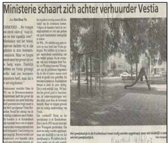
De opheffing van de Bewonerscommissie Kruidenbuurt ging in 2003 niet onopgemerkt voorbij.

Anno 2015 is het waarschijnlijk dat zeker de helft van de doorzonwoningen inmiddels niet meer in bezit van Vestia is. Na het financiële debacle van Vestia in 2011-2012, veroorzaakt door het nemen van te grote financiële risico's door de directie van Vestia, heeft de woningcorporatie veel geld nodig voor schuldsanering. In de afgelopen jaren is de verkoop van woningen in de Kruidenbuurt dan ook in een stroomversnelling geraakt.