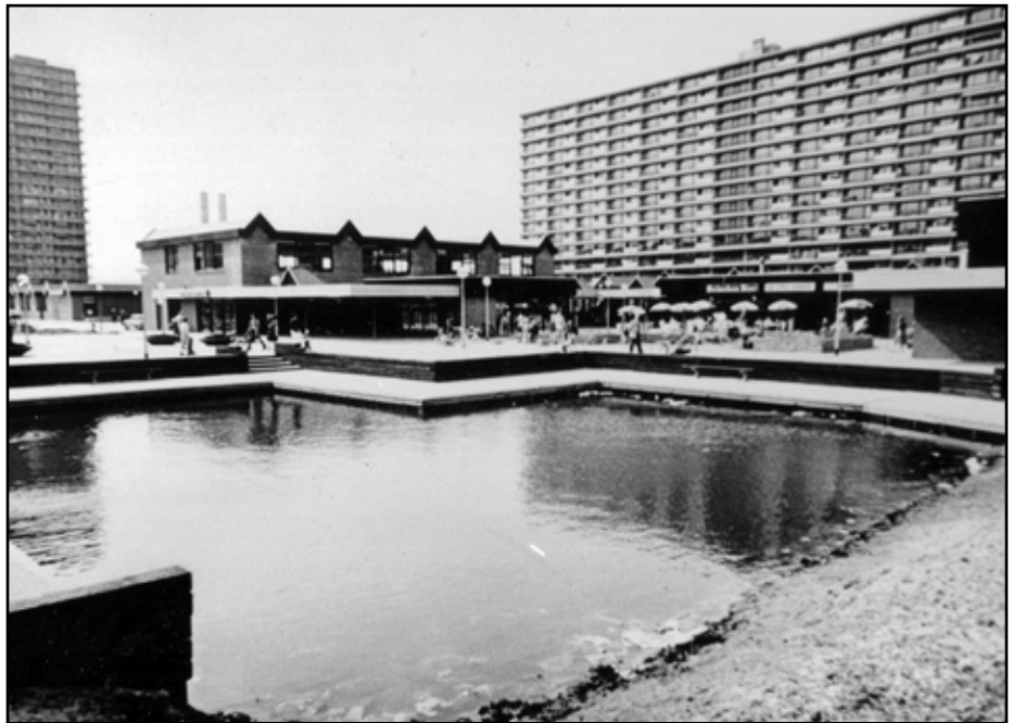
Ommoord, Binnenhof rond 1975.