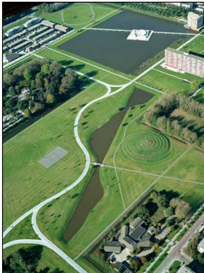
Het Prinsenpark met rechtsboven Het Vierkant Eiland in de Plas.