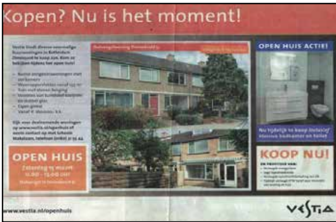
Een wervende advertentie van Vestia uit 2014.

zen. Er komen jonge gezinnen voor in de plaats. Leuk zou je zeggen, weer wat jong leven in de wijk. Alleen deze jeugd denkt dat zij het recht heeft om datgene wat wij met plezier en energie tot stand hebben gebracht in de kortste tijd te mogen vernielen. Struiken worden kapot getrokken, de heg wordt gebruikt als trampoline en als de voetbal in de tuin terecht komt breken ze de heggenstruiken open om naar binnen te kunnen gaan. Als je hier een opmerking over maakt krijg je te horen dat je op moet rotten naar een bejaardenhuis." Anders gezegd: er ontstaan spanningen tussen de oorspronkelijke bewoners en nieuwkomers over waar de Kruidenbuurt voor staat. Ouderen koesteren vooral hun rust en plannen voor verandering, ook vanuit woningcorporatie Vestia Rotterdam Noord, worden op een goudschaaltje gewogen. Jongeren klagen dat er in de Kruidenbuurt zo weinig voor hen te doen is, terwijl weer andere jongeren, waarvan niet altijd even duidelijk is of ze uit de Kruidenbuurt zelf komen, de buurt gebruiken of liever gezegd misbruiken voor soms dubieuze activiteiten: juist omdat het er zo rustig is. De vele parkjes en speelplaatsen in de buurt bieden ruime mogelijkheden.