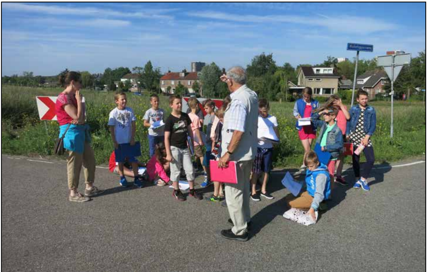
Leerlingen van de plusklas van Het Spectrum bij het driepolderpunt.