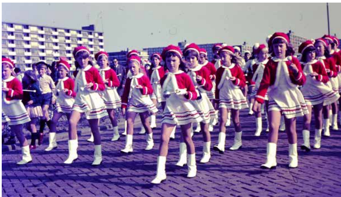
Majorettenkorps Prins Alexander.