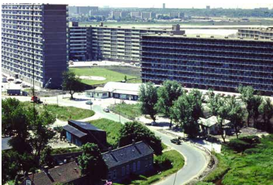
De Ommoordseweg, circa 1970.

De aanbesteding vond plaats op 6 november 1873 en met het werk moest worden begonnen "onmiddellijk na de aanschrijving" en twintig weken later moest de weg worden opgeleverd. In het bestek waren eenheidsprijzen opgenomen, zoals twaalf cent voor het graven en laden in de kruiwagen en vier cent voor het vervoer per kruiwagen van een kubieke meter grond voor elke twintig meter afstand. Let wel, er gaan