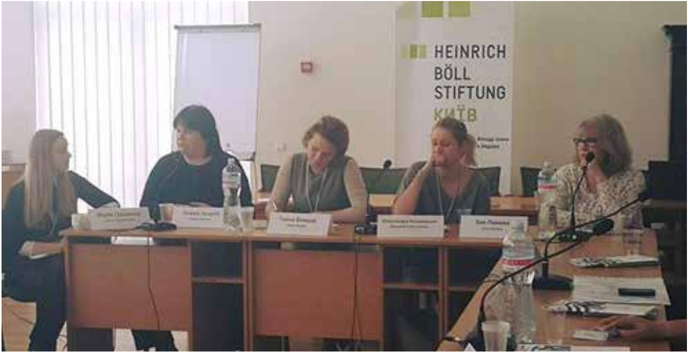
Panel architecten uit Kiev en Charkov.

exemplarisch voorbeeld van ‘gender sensitive urbanism’ (gendersensitieve verstedelijking).