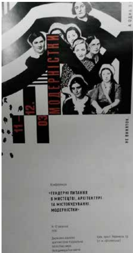
Poster conferentie in Kiev 11 en 12 maart 2016.

De conferentiedagen waren boeiend en inspirerend. Wat ik van tevoren niet wist, was dat de voertaal Oekraïens zou zijn. Dat betekende dat voor de niet-Oekraïens sprekenden alle lezingen simultaan werden vertaald in ofwel Engels ofwel Russisch en voor de niet-Engels sprekenden in ofwel Oekraïens of Russisch. Je luisterde naar de presentaties met een koptelefoon op. De eerste dag stond in het teken van het verleden en de tweede in dat van het heden.