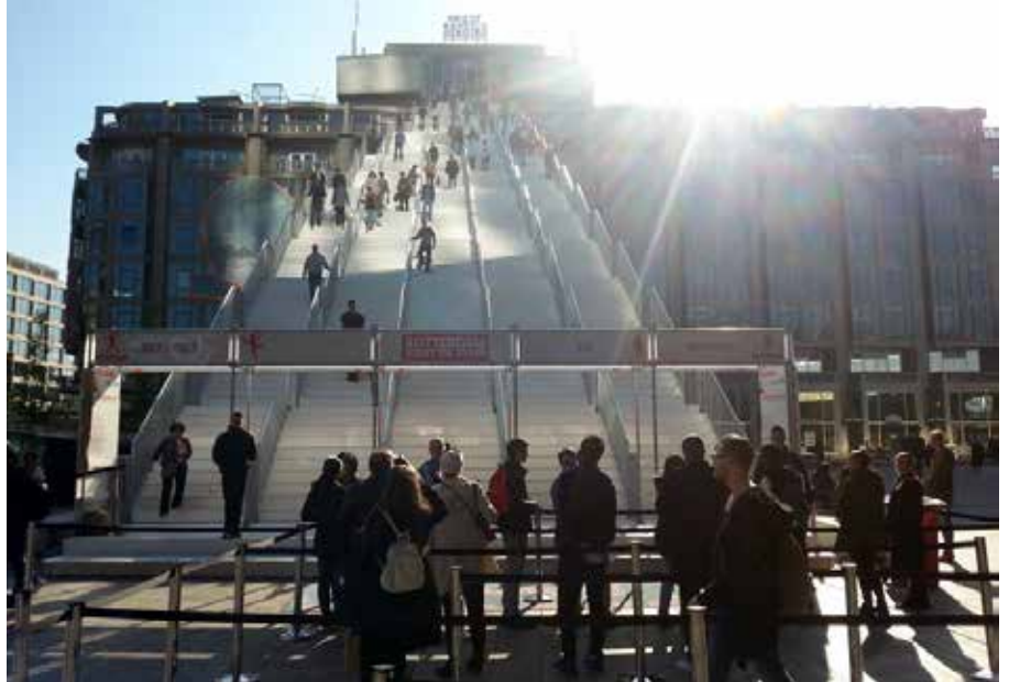
De Trap bij Rotterdam CS - Rotterdam Viert de Stad.