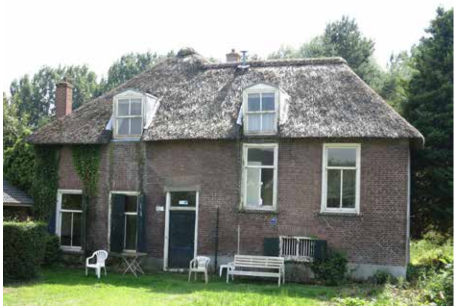
's-Gravenweg 421 - gemeentelijk monument