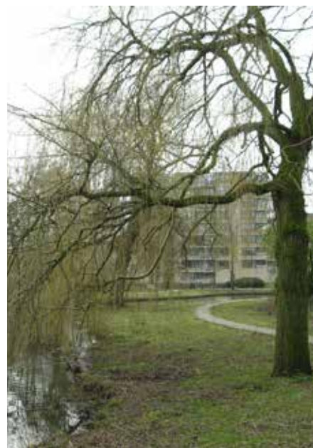
Het Semiramispark en de Varnasingel

Dit artikel werd eerder gepubliceerd in de Oosterflankkrant van december 2015.