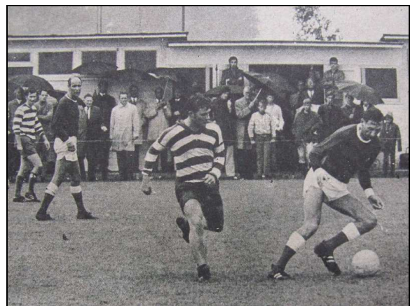
Faas Wilkes in actie tijdens de openingswedstrijd van de velden aan de Folkert Elsingastraat, juli 1969

Bij het eenjarig bestaan van Alexandria '66 drukt de uitgever van het wijkblad Prins Alexanderstad een speciale krant die huis aan huis wordt verspreid en de vereniging veel goodwill oplevert. Het spelen zo ver van de eigen wijk duurt twee seizoenen. Langzamerhand krijgt men meer steun van de gemeente die ook inziet welke functie de club binnen de wijk heeft. Bij aanvang van het seizoen 1969 -1970 kunnen twee school-sportvelden aan de Folkert Elsingastraat worden betrokken en is Alexandria '66 eindelijk thuis in de eigen wijk. De opening van de velden wordt een bijzonder druk bezocht festijn. Niemand minder dan Nederlands stervoetballer uit vroeger tijden, Faas Wilkes, verricht de openingshandeling. Hij treedt zelfs nog een helft aan in de openingswedstrijd.