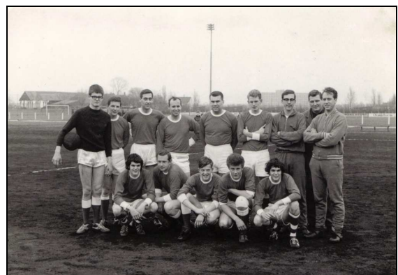
Eerste wedstrijd senioren op uitkoolasveld Unicum

Voetbalvereniging Capelle ontvangt gastvrij enkele jeugdteams. Op 5 maart mogen ook de senioren hun debuut maken. Ze spelen op het uitkoolas bestaande trainingsveld van Unicum in Schiebroek. Dat uitkoolas is niet ongevoerd in die tijd. Bij gebrek aan trainingsaccommodatie wordt op zondagmorgen geoefend op het aloude Schuttersveld in Crooswijk met dezelfde ondergrond.