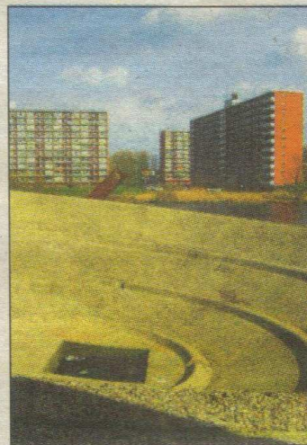
Locatie tussen Het Lage Land en Prinsenland.

schiedenis van de polder door het organiseren van lezingen en ledenavonden en het maken van publicaties en presentaties. Vier maal per jaar verschijnt de nieuwsbrief van de vereniging. De interactieve website van de HVPA is het platform voor de geschiedenis van de Prins Alexanderpolder. De HVPA wordt financieel ondersteund door deelgemeente Prins Alexander.